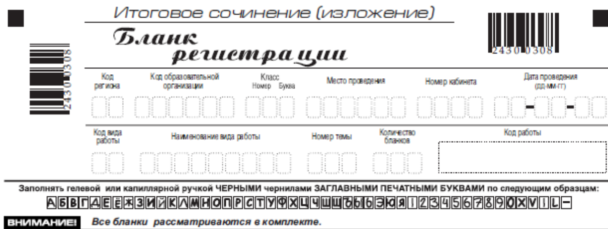
Рис. 2. Верхняя часть бланка регистрации

По указанию членом комиссии кабинете участником заполняются все поля верхней части бланка регистрации (см. табл. 1).